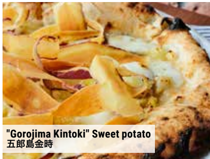
"Gorojima Kintoki" Sweet potato 五郎島金時