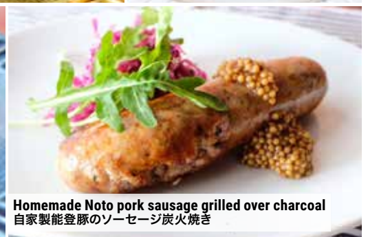
Homemade Noto pork sausage grilled over charcoal 自家製能登豚のソーセージ炭火焼き