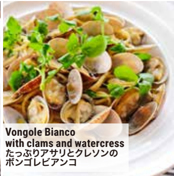
Vongole Bianco with clams and watercress たっぷりアサリとクレソンのボンゴレビアンコ