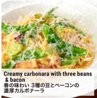
Creamy carbonara with three beans & bacon 春の味わい 3種の豆とベーコンの濃厚カルボナーラ