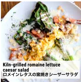
Kiln-grilled romaine lettuce caesar salad ロメインレタスの窯焼きシーザーサラダ