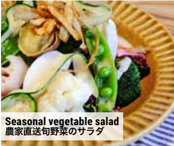
Seasonal vegetable salad 農家直送旬野菜のサラダ

We have a one drink and food minimum policy