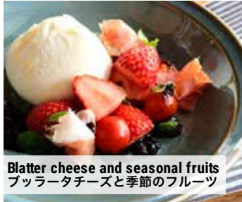
Blatter cheese and seasonal fruits ブッラータチーズと季節のフルーツ