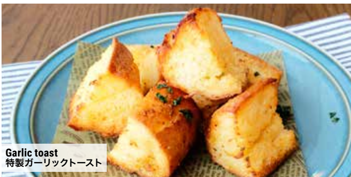
Garlic toast 特製ガーリックトースト