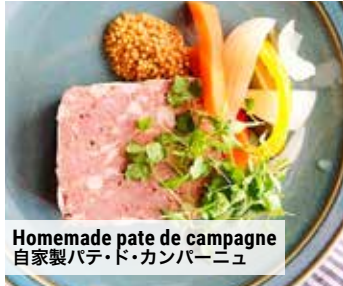
Homemade pate de campagne 自家製パテ・ド・カンパーニュ