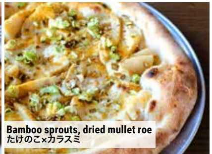
Bamboo sprouts, dried mullet roe たけのこ×カラスミ