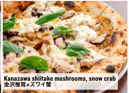
Kanazawa shiitake mushrooms, snow crab 金沢椎茸×ズワイ蟹

We have a one drink and food minimum policy