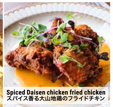
Spiced Daisen chicken fried chicken スパイス香る大山地鶏のフライドチキン