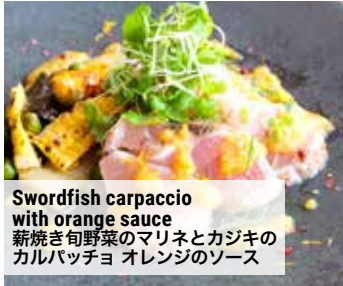
Swordfish carpaccio with orange sauce 薪焼き旬野菜のマリネとカジキのカルパッチョ オレンジのソース