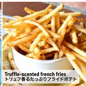
Truffle-scented french fries トリュフ香るたっぷりフライドポテト