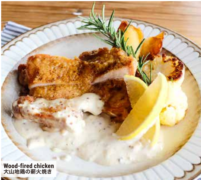
Wood-fired chicken 大山地鶏の薪火焼き