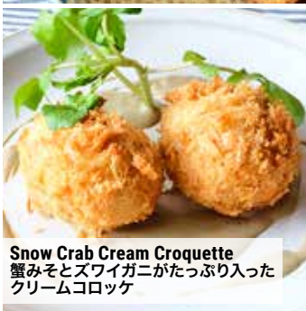
Snow Crab Cream Croquette 蟹みそとズワイガニがたっぷり入った クリームコロッケ