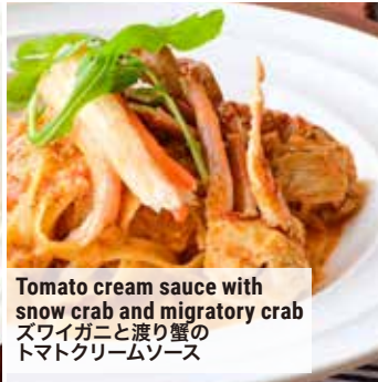
Tomato cream sauce with snow crab and migratory crab ズワイガニと渡り蟹のトマトクリームソース