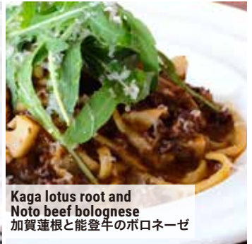
Kaga lotus root and Noto beef bolognese 加賀蓮根と能登牛のボロネーゼ

We have a one drink and food minimum policy