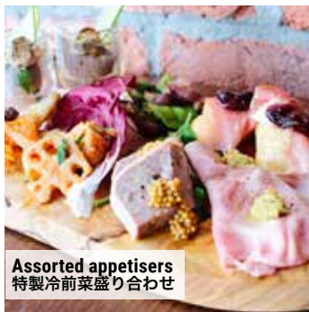
Assorted appetisers 特製冷前菜盛り合わせ