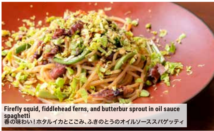
Firefly squid, fiddlehead ferns, and butterbur sprout in oil sauce spaghetti 春の味わい! ホタルイカとこごみ、ふきのとうのオイルソーススパゲッティ