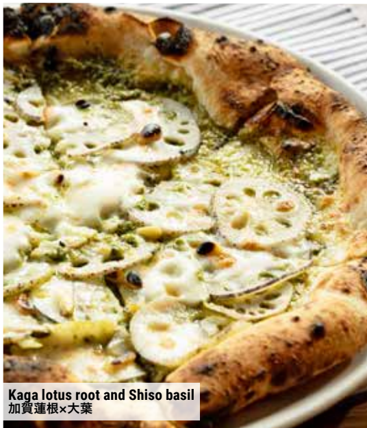
Kaga lotus root and Shiso basil 加賀蓮根×大葉