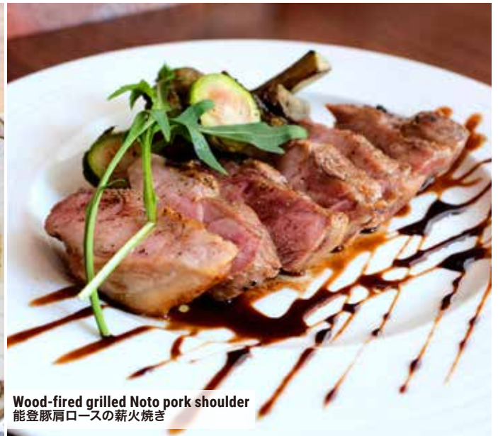
Wood-fired grilled Noto pork shoulder 能登豚肩ロースの薪火焼き