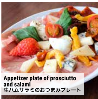
Appetizer plate of prosciutto and salami 生ハムサラミのおつまみプレート