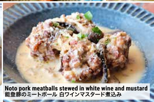
Noto pork meatballs stewed in white wine and mustard 能登豚のミートボール 白ワインマスタード煮込み