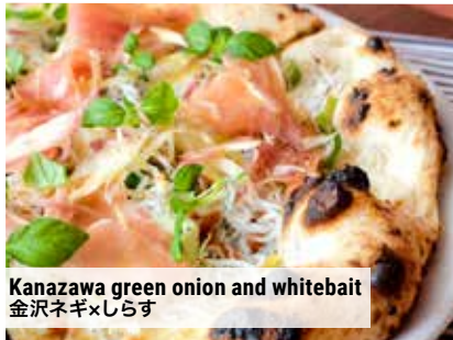
Kanazawa green onion and whitebait 金沢ネギ×しらす