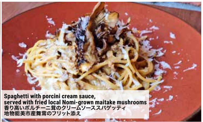
Spaghetti with porcini cream sauce, served with fried local Nomi-grown maitake mushrooms 香り高いポルチーニ茸のクリームソーススパゲッティ 地物能美市産舞茸のフリット添え