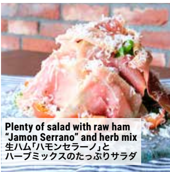
Plenty of salad with raw ham "Jamon Serrano" and herb mix 生ハム「ハモンセラノ」とハーブミックスのたっぷりサラダ