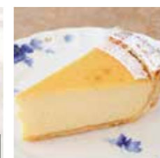
濃厚バイクドチーズ ケーキ +50 Baked cheese cake