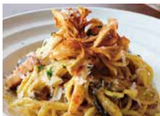
地物 3 種キノコと濃厚能登鶏卵の カルボナーラ