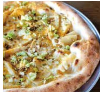
たけのこ Bamboo sprouts (たけのこ / モッツァレラ / グラナパダーノ / ボッタルガ / ふきのとう) (Bamboo shoots / Mozzarella / Grana Padano / Bottarga / Fukinoto)