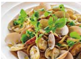
たっぷりアサリとクレソンのボンゴレビアンコ