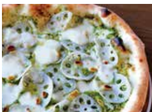
金澤ピッツァ 加賀蓮根