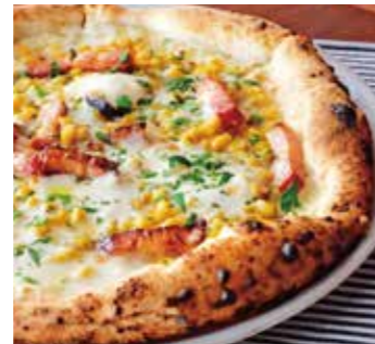
とうもろこしとベーコンの マヨコーン Corn, bacon and mayonnaise (スイートコーン / コーンソース / ベーコン / モッツァレラ) (sweet corn / corn sauce / bacon / mozzarella)