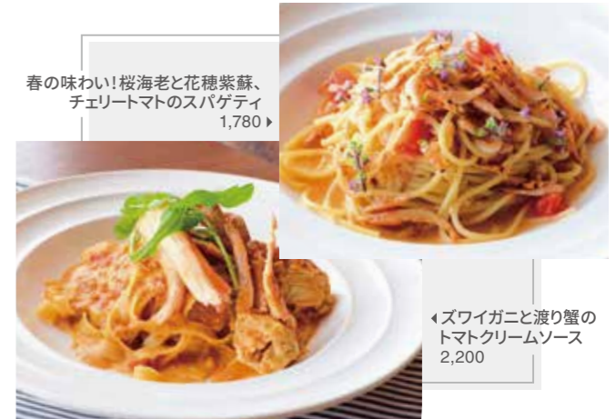
春の味わい! 桜海老と花穂紫蘇、 チェリートマトのスパゲティ 1,780

|| ズワイガニと渡り蟹のトマトクリームソース 2,200 Tomato cream sauce with snow crab and migratory crab