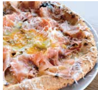
くちどけ生ハムと玉子の ビスマルク Bismarck (マッシュルーム / モッツァレラ / 半熟卵 / トリュフオイル / 生ハム / グラナパダーノ) (mushrooms / mozzarella / soft-boiled egg / truffe oil / prosciutto / grana padano)