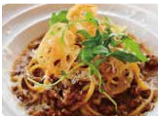
加賀蓮根と能登牛のボロネーゼ