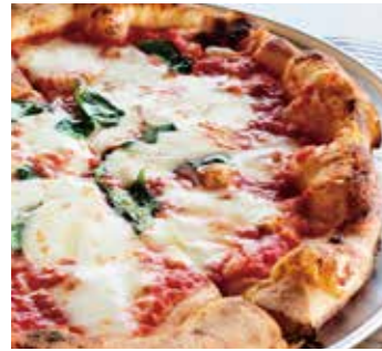
自慢のマルゲリータ Margherita (トマトソース / バジル / モッツァレラ) (tomato sauce / basil / mozzarella)