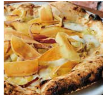
五郎島金時 "Gorojima Kintoki" Sweet potato (さつまいも / ゴルゴンゾーラ / モッツァレラ / グラナパダーノ / 金沢蜂蜜) (Sweet Potato / Gorgonzola / Mozzarella / Grana Padano / Kanazawa Honey)