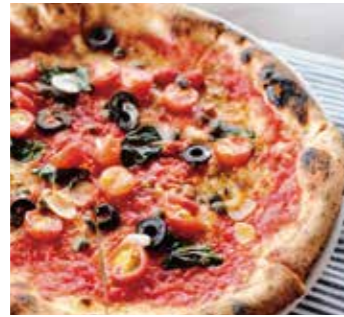
アンチョビとオリーブの シチリアーナ Siciliana (チェリートマト / オレガノ / バジル / アンチョビ / オリーブ・ケッパー) (cherry tomato / oregano / basil / anchovies / olive capers)