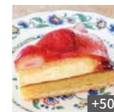
苺タルト +50 Strawberry tarts