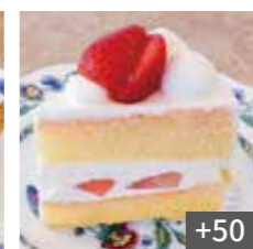
苺のスペシャル ショート +50 Strawberry short cake