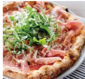
くちどけ生ハムとルッコラ Prosciutto e Rucola (生ハム / トマト / モッツァレラ / ルッコラ) (prosciutto / tomato / mozzarella / rucola)