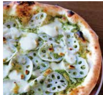
加賀蓮根 Kaga lotus root (ジェノベーゼ / 蓮根 / モッツァレラ / グラナパダーノ / 松の実) (Genovese / Lotus root / Mozzarella / Grana padano / Pine nuts)