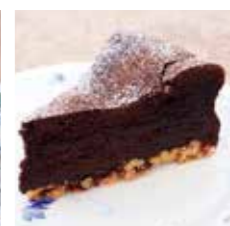
ナッツのガトー ショコラ Gateau chocolate