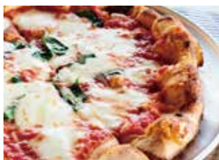
自慢のマルゲリータ