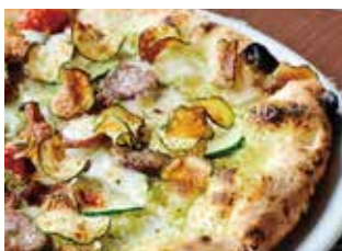
旬野菜のきまぐれピザ