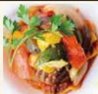
仏風野菜のトマトの煮込み ラタトゥイユ