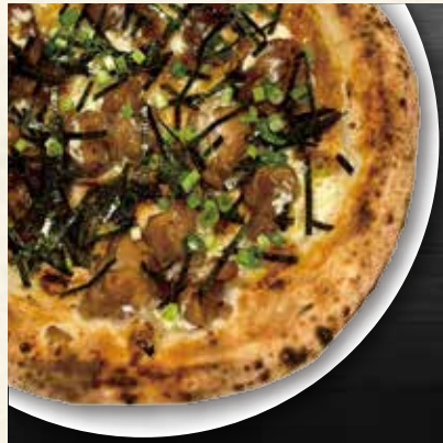
自家製テリヤキピッツァ