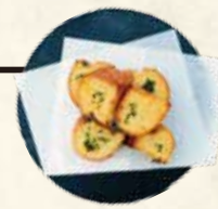
特製ガーリックトースト