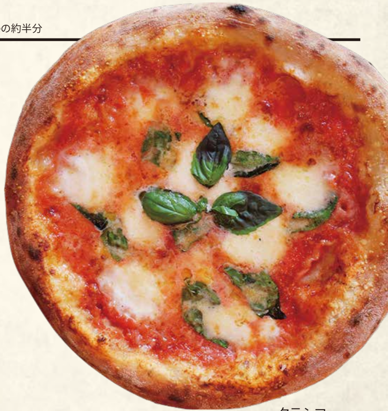
クラシコ・ マルゲリータ