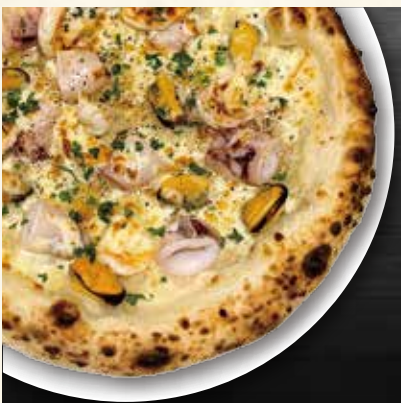
シーフードピッツァ