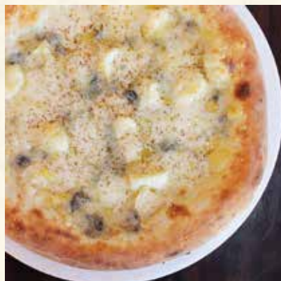
4種チーズのクアトロフォルマッジ