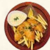
フィッシュ&チップス