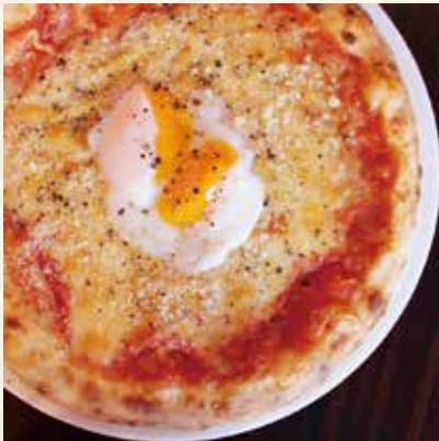
卵とベーコンのビスマルク