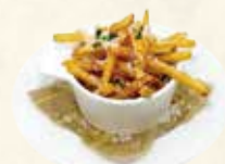
進化系カリカリフライドポテト パルミジャーノチーズ掛け