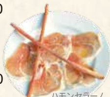
ハモンセラノ 24カ月熟成生ハム & グリッシーニ