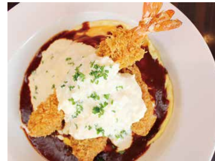
HANTON rice 金沢のソウルフード ハントンライス 単品 ¥1,500