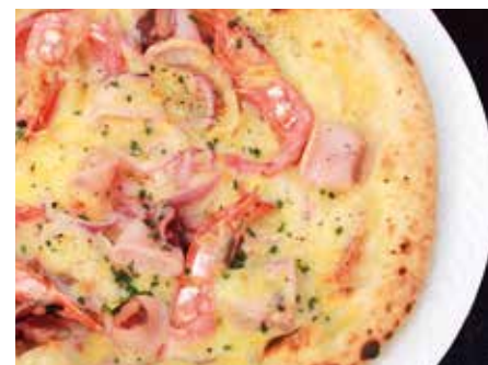
Chef's caprice 気まぐれピザ 単品 ¥1,450