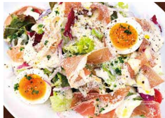
▲シーザーサラダ Caesar salad