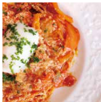
シェフこだわり大人の★ ナポリタン 単品 ¥1,000