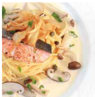
秋鮭と木の子をふんだんに 使ったクリームソース 単品 ¥1,350