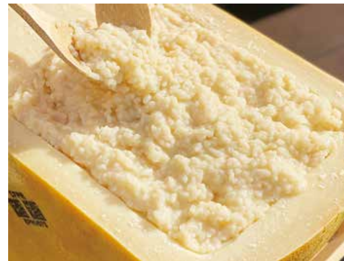
Cheese risotto 名物! パルミジャーノレッジャーノの 濃厚チーズリゾット 単品 ¥1,200