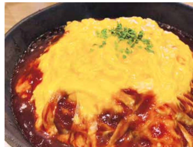
Omelette rice NEW! ふわたロ! スキレットオムライス ★ 単品 ¥880