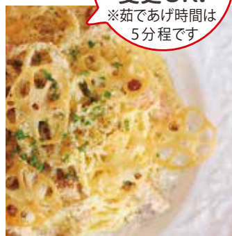
加賀野菜と厚切りベーコンの カルボナーラ 単品 ¥1,200