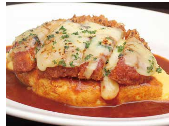
Omelet rice with pork cutlet NEW! モッツアレラチーズカツのボルガライス 単品 ¥1,250