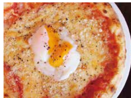
Bismarck 卵とベーコンのビスマルク 単品 ¥1,350