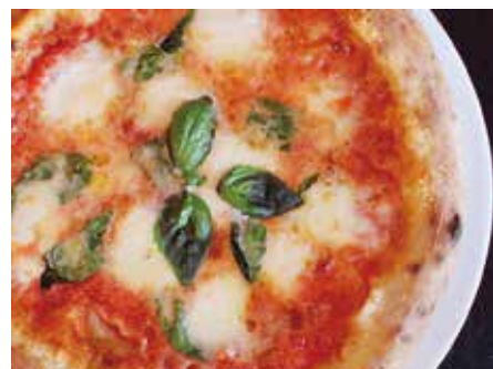
Margherita 当店自慢のクラシコ・マルゲリータ★ 単品 ¥1,350