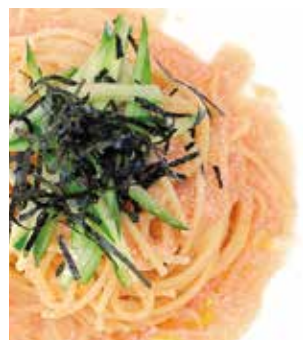
絶品! 明太子のスパゲッティ 単品 ¥1,000